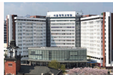
서울대학교 암연구소내 협력 연구기관(혜화동)